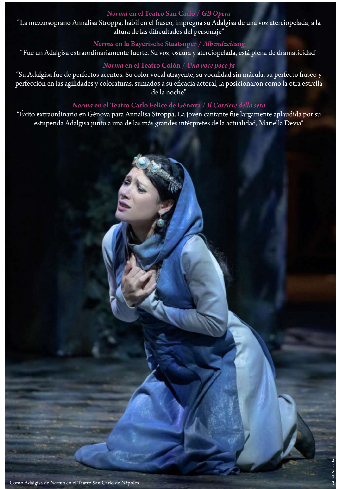
Como Adalgisa de Norma en el Teatro San Carlo de Nápoles