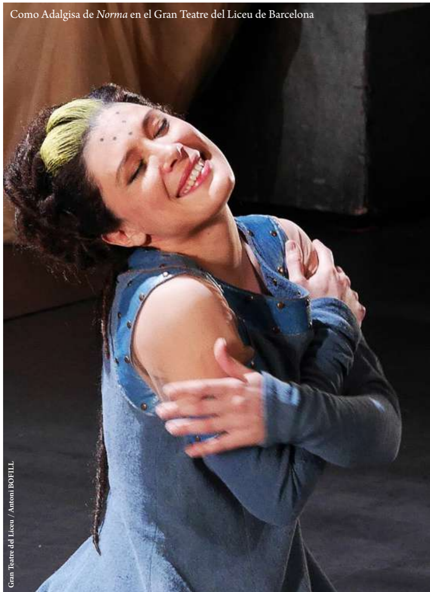
Como Adalgisa de Norma en el Gran Teatre del Liceu de Barcelona

Además, en temporadas anteriores destacan, entre otros compromisos, Carmen por segundo año consecutivo en el Festival Bregenz, Così fan tutte en Turín, Carmen en Las Palmas, Anna Bolena en Verona, Nabucco en Milán, I Capuleti e i Montecchi en Padua, Il barbiere di Siviglia en Dresde y Bilbao, La Cenerentola en Tel Aviv, Così fan tutte en Viena, Benvenuto Cellini de Berlioz en Barcelona, Madama Butterfly en París, Il marito disperato de Cimarosa en Nápoles, Hänsel und Gretel de Humperdinck en Turín, Roméo et Juliette de Gounod en Génova, Cavalleria Rusticana de Mascagni en Roma y Salzburgo, Il Mondo della luna de Haydn en Montecarlo y Le nozze di Figaro de Mozart en Módena y Lausana.