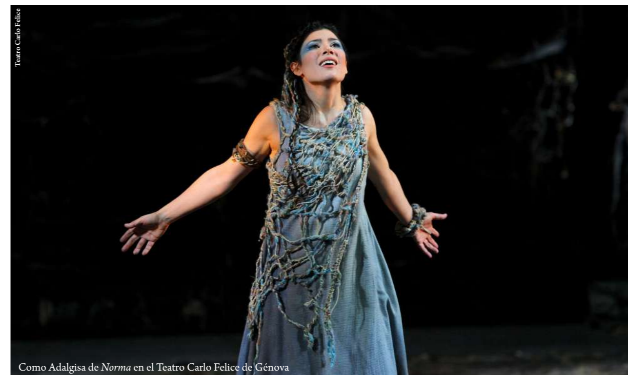
Como Adalgisa de Norma en el Teatro Carlo Felice de Génova

de Madrid, el Liceu de Barcelona, en ABAO Bilbao Opera, el Festival de Salzburgo, la Wiener Staatsoper, el Festival de Bregenz, la Ópera israelí de Tel-Aviv, la Ópera de Montecarlo, la Ópera de Lausana, la Ópera de París y La Scala de Milán. Hizo su debut en los Estados Unidos con Les Nuits d'été de Berlioz con la Orquesta Sinfónica de Dallas.